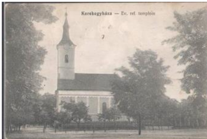
Az „ev.ref” rövidítés feloldása: „evangélium szerint reformált.”

1940-41-ben készült képes levelezőlap képek: