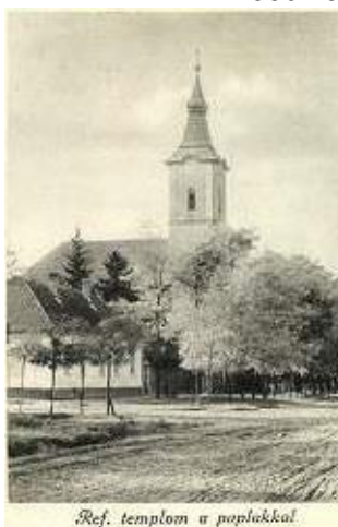
Ref. templom a poplakkal.

Ebben bízva köszönti Önöket: a Kerekegyházi Lokálpatrióták Egyesülete!