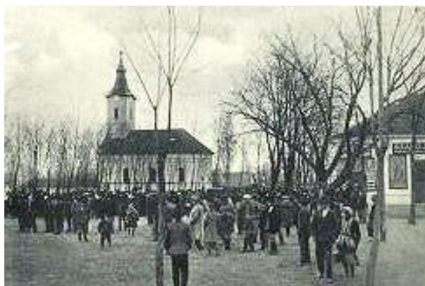
Március 15-ei ünnepély

1940-41-ben készült képes levelezőlap képek: