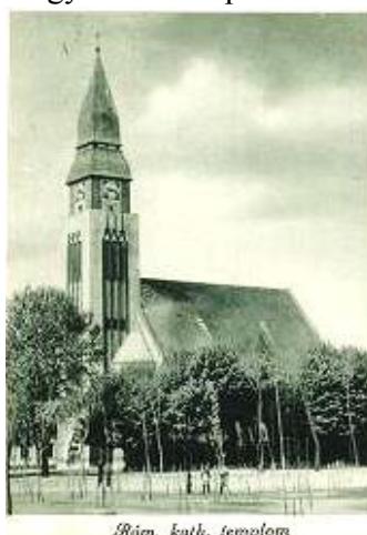
Róm. katli. templom